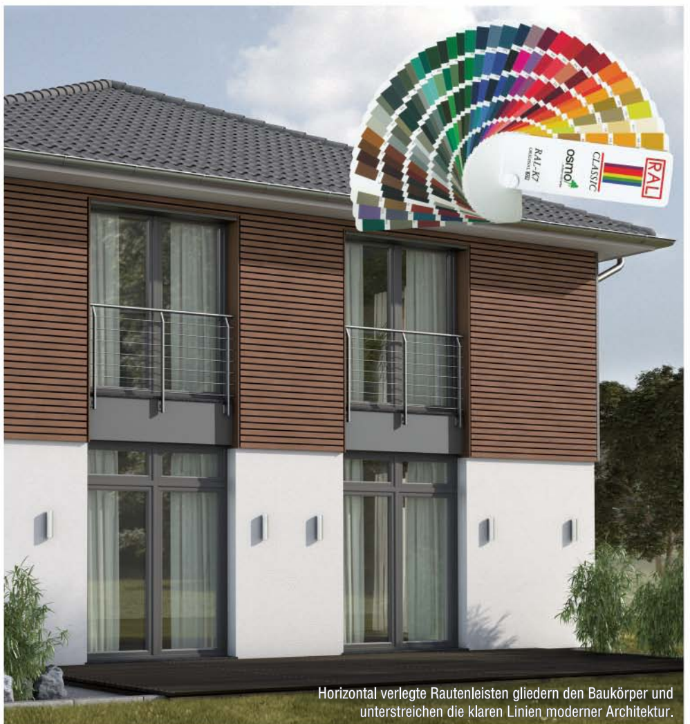
Horizontal verlegte Rautenleisten gliedern den Baukörper und unterstreichen die klaren Linien moderner Architektur.