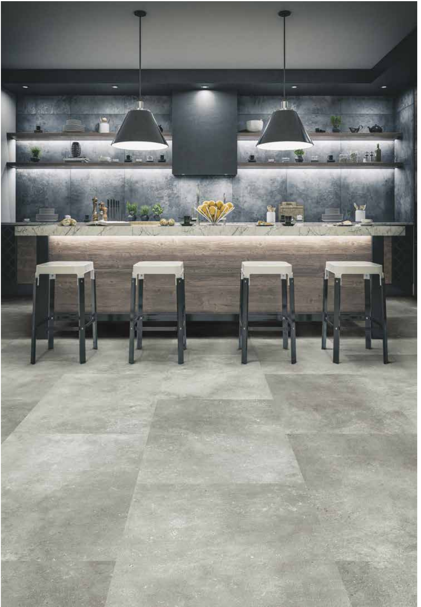
Naturalan | Gladstone grey