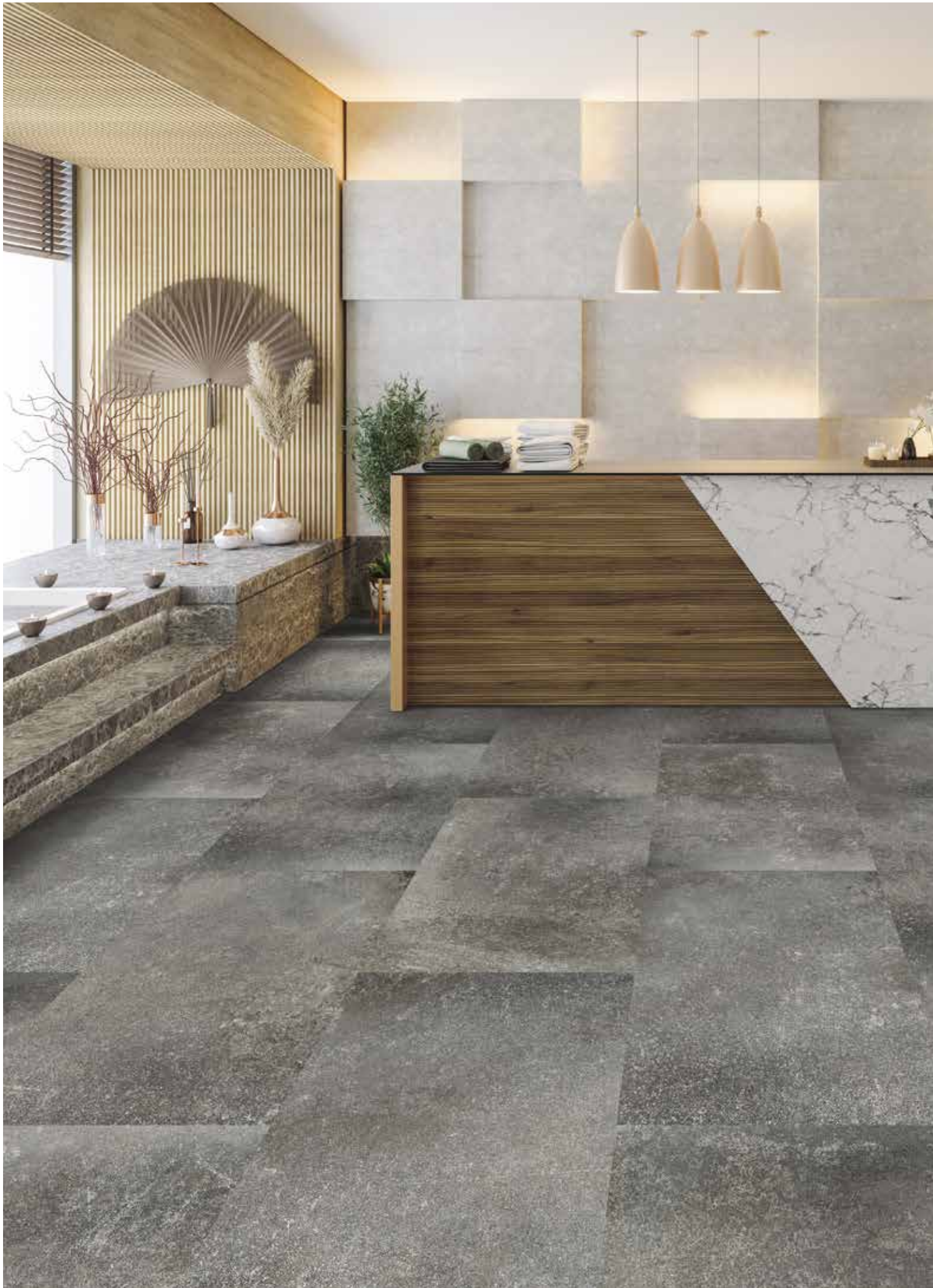
Naturalan | Artstone Lismore