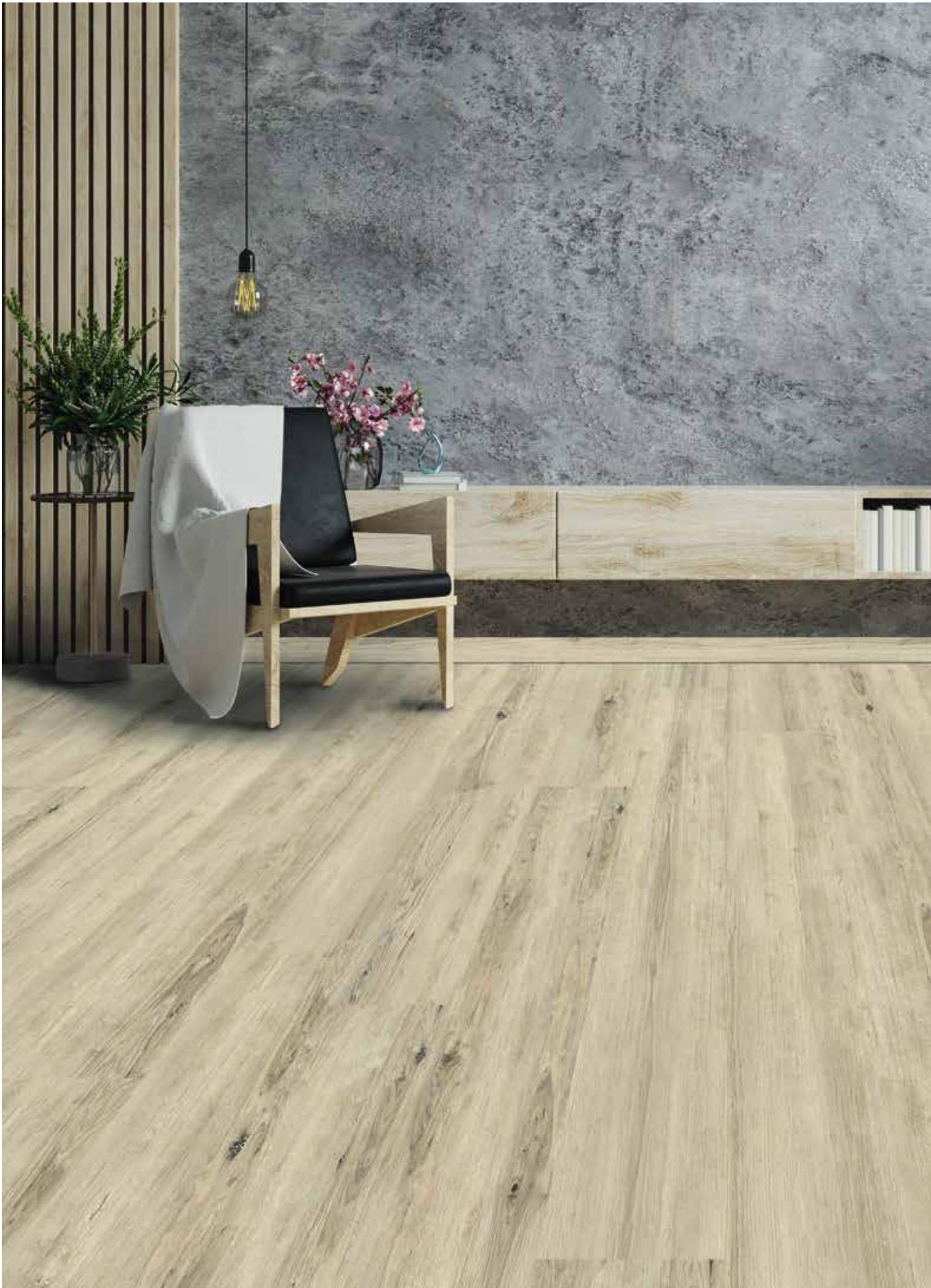
Naturalan | Oak Cairns